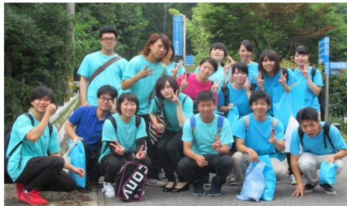
福祉施設見学実習 in 大分県別府市

社会福祉学専攻の3・4年生18名が、大分県別府市に福祉研修旅行に行きました!(2017年8月)