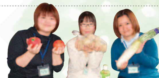
りんご娘・ポテト娘・大根娘

第13回魁祭は、晴天の中、地域の皆様をはじめ多くの方に来場いただき、盛大に行うことができました。今年度も魁会(同窓会)では、県内産の新鮮な野菜や果物を取り揃え、恒例の野菜市を出店! 開店前から「今年はどんなお野菜があるの?」、「果物はあるかしら?」と、問い合わせいただき、「行列」も当たり前前の光景となり嬉しいかぎりです。いつも早く、新鮮で美味しいお野菜を提供してくださる農家様、個人で作られているお野菜を提供していただいた皆様、本当に有難うございました。また、同窓生の皆さんが大学へ遊びに来てくださることが、役員のパワーとなっています。来年も皆さんにお会いできることを楽しみに、出店する予定ですので宜しくお願い致します。